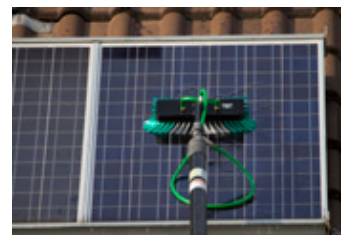
Das Reinstwasser wird am oberen Ende der Teleskopstange ausgeleitet und durch den Bürstenkörper gleichmäßig auf die Borsten und auf die darunterliegenden Solarzellen verteilt.