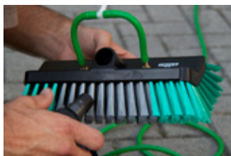
Eine speziell für die Solarzellenreinigung konzipierte Bürste gewährleistet eine schonende und gründliche Reinigung.

Die Ertragssteigerung, die bei starker Verschmutzung bis zu 30% beträgt, macht die Reinigung Ihrer Anlage in jedem Fall innerhalb kürzester Zeit bezahlt.