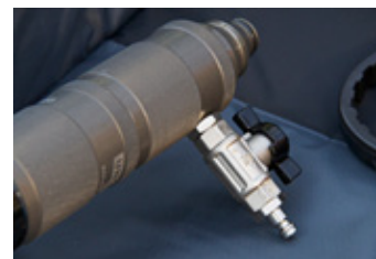
Mittels des Einlassstutzens wird das Reinstwasser dem Transportkanal im Inneren der Carbonstange zugeführt.

Selbst Solaranlagen in einer Höhe von 20 Metern werden schnell und effektiv erreicht und gereinigt.