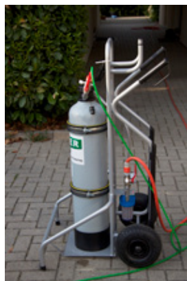
Mit dem mobilen Harzfilter wird das entmineralisierte Reinstwasser hergestellt, welches auf der gereinigten Fläche rückstandsfrei abtrocknet.

Ein dünner 25 Meter Spezialschlauch transportiert ohne Druckverlust das entmineralisierte Wasser vom Filter zum unteren Ende der Teleskopstange.